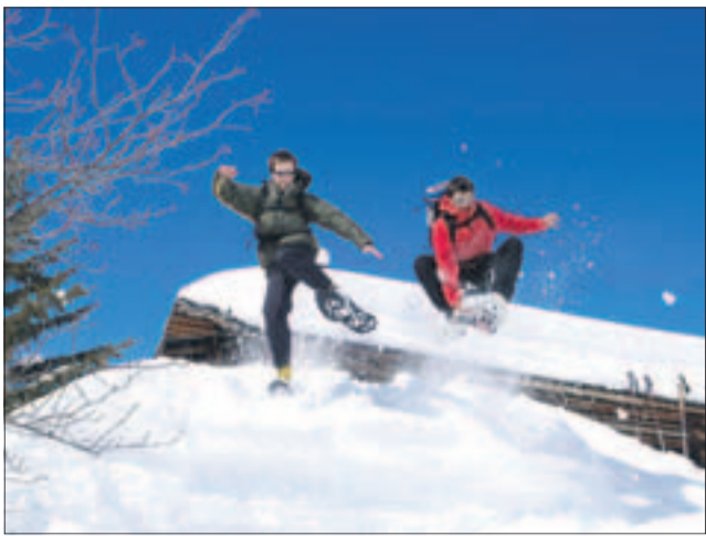
Lumikengillä pääsee mihin vain, korpeen ja katolle. Lumikenkäily on tehokasta liikuntaa: hiki on taattu.